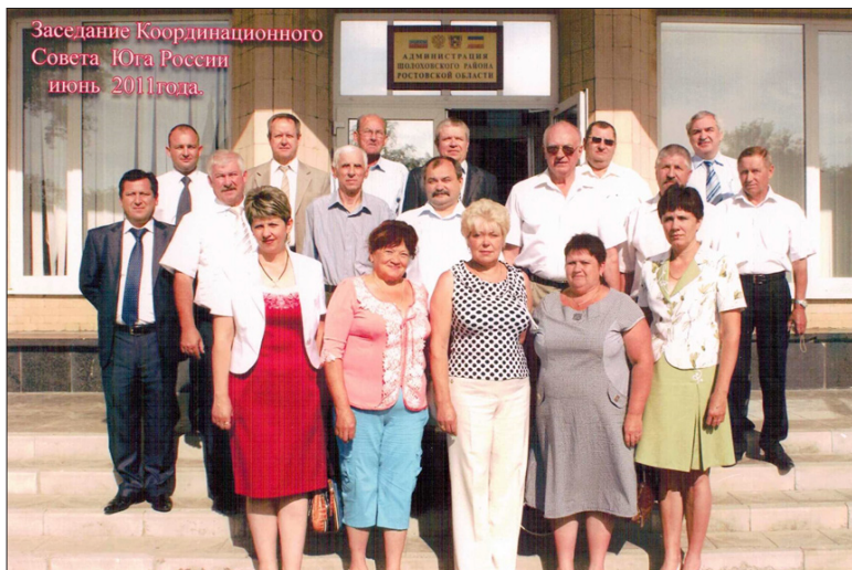
Участники заседания Координационного совета регионов Юга России. ст. Вешенская, Ростовская область, июнь 2011 год