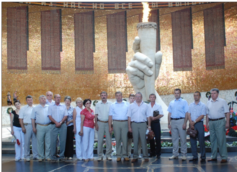
Делегации участников Соглашения у Вечного огня на Мамаевом кургане. Июль 2008 года