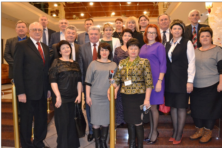
Участники заседания Координационного совета регионов Юга России. г. Сочи, декабрь 2016 год