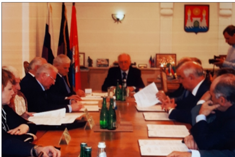
Заседание Координационного совета регионов Юга России. Дагестан, г. Махачкала, октябрь 2012 год