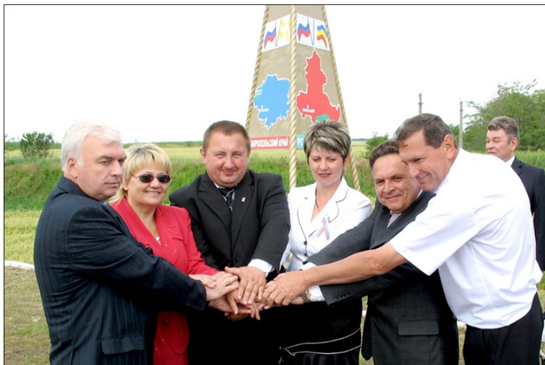
Рукопожатие – символ содружества. Открытие стелы «Содружество», граница Ростовской области, Краснодарского и Ставропольского краев.