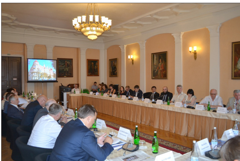
Заседание Координационного совета регионов Юга России. г. Ростов-на-Дону, июнь 2017 год