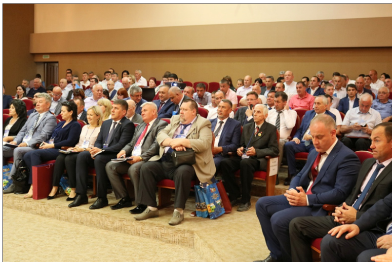
Заседание Координационного совета регионов Юга России. г. Владикавказ, июнь 2018 год