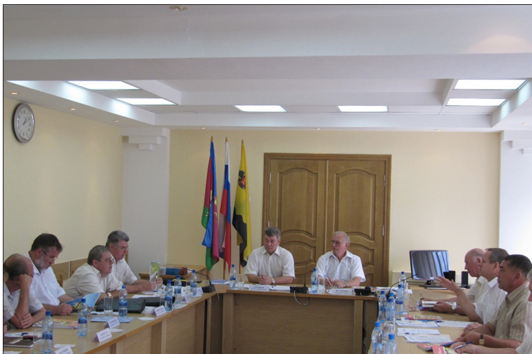
Заседание Координационного Совета регионов Юга России. Новороссийск, июль 2009 год