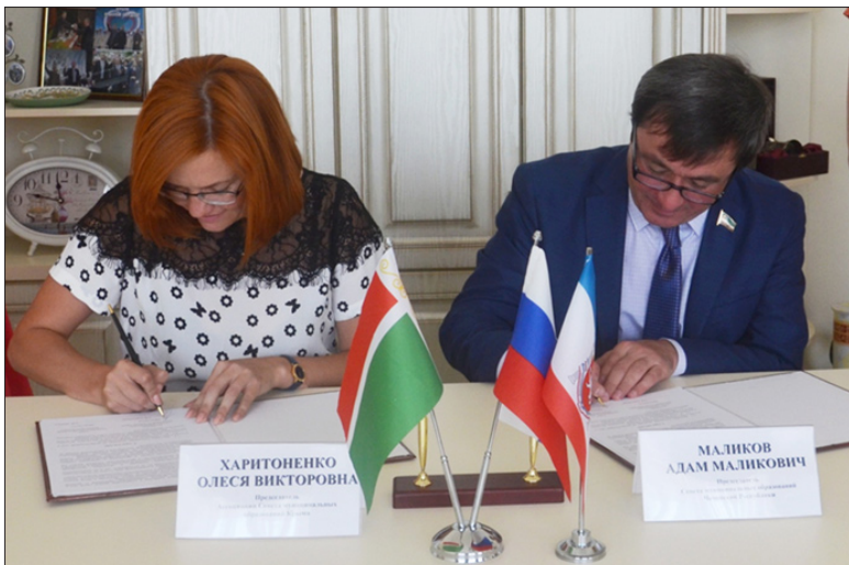
Подписание межрегионального соглашения между Советами муниципальных образований Республики Крым и Чеченской Республики. г. Евпатория, 2015 год