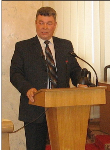
Грошев С.М. – председатель Координационного Совета регионов Юга России с июля 2009 г. по февраль 2011 г.