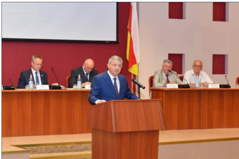
Заседание Координационного совета регионов Юга России. Приветствие Главы Республики Северная Осетия-Алания Битарова В.З. г. Владикавказ, июнь 2018 год