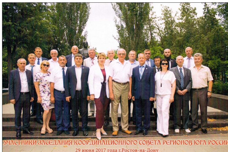
Участники заседания Координационного совета регионов Юга России. г. Ростов-на-Дону, июнь 2017 год