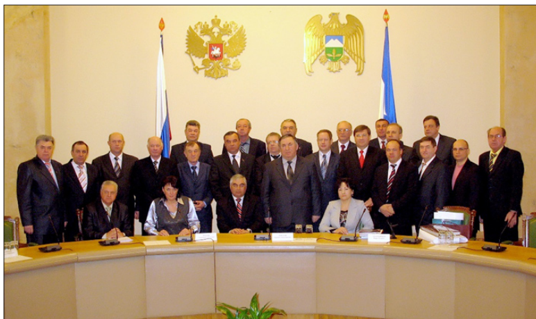
Участники заседания. Нальчик, январь 2009 год