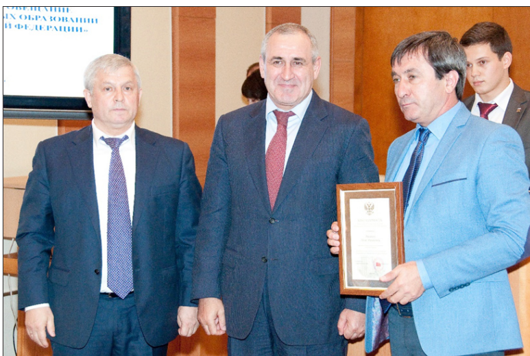
Награждение Совета муниципальных образований Чеченской Республики за активное участие в становлении и развитии местного самоуправления