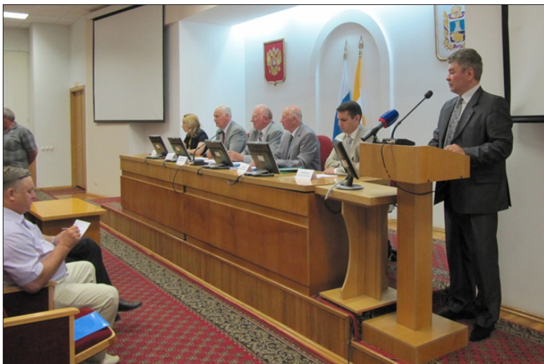
Участники заседания Координационного совета регионов Юга России. г. Ставрополь, май 2012 год