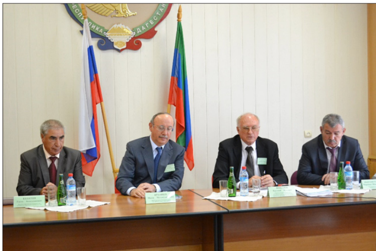
Заседание Координационного совета регионов Юга России. Дагестан, г. Дербент, октябрь 2012 год