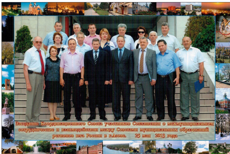
Заседание Координационного Совета участников Соглашения о межмуниципальном сотрудничестве и взаимодействии между Советами муниципальных образований районов Юга России в г. Азове. 25 мая 2013 года