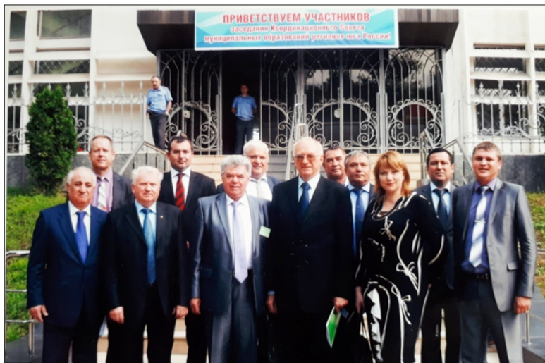
Участники заседания Координационного совета регионов Юга России. Дагестан, г. Махачкала, октябрь 2012 год