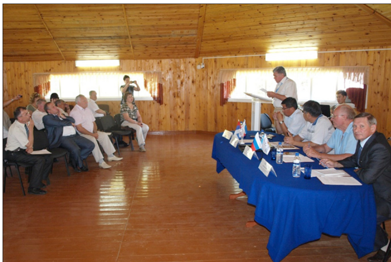
Межрегиональная конференция Советов муниципальных образований Алтайского и Забайкальского краев, Республики Бурятия, Кабардино- Балкарской Республики, Волгоградской и Ростовской областей. Бурятия, июль 2012 год