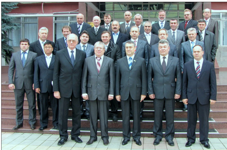
Участники заседания Координационного Совета регионов Юга России. г. Майкоп, декабрь 2009 год