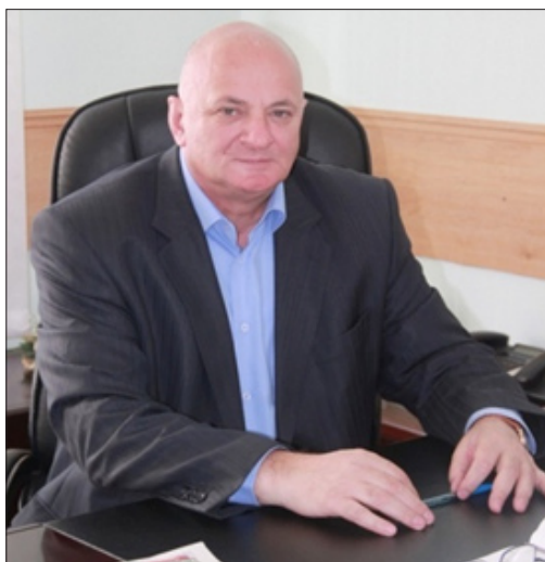
Накусов Борис Дагкоевич Глава муниципального образования Кировский район, член Совета при Президенте РФ по развитию местного самоуправления, член президиума Общероссийского конгресса муниципальных образований