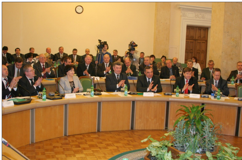
Заседание участников Соглашения. Нальчик, январь 2009 год