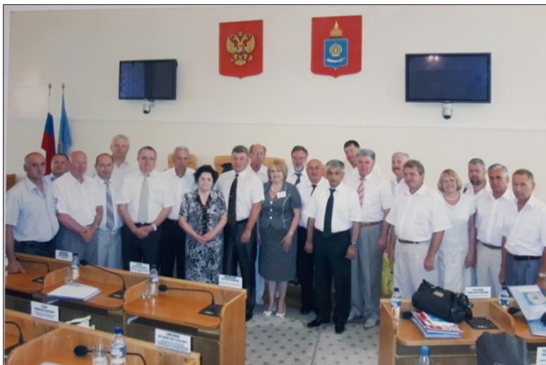
Участники заседания Координационного Совета регионов Юга России. г. Астрахань, сентябрь 2010 год.