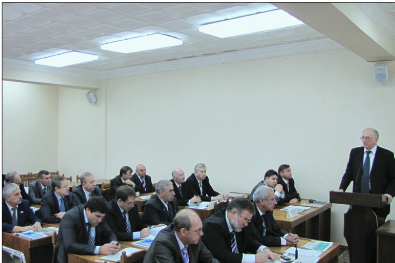
Заседание Координационного Совета регионов Юга России. г. Майкоп, декабрь 2009 года