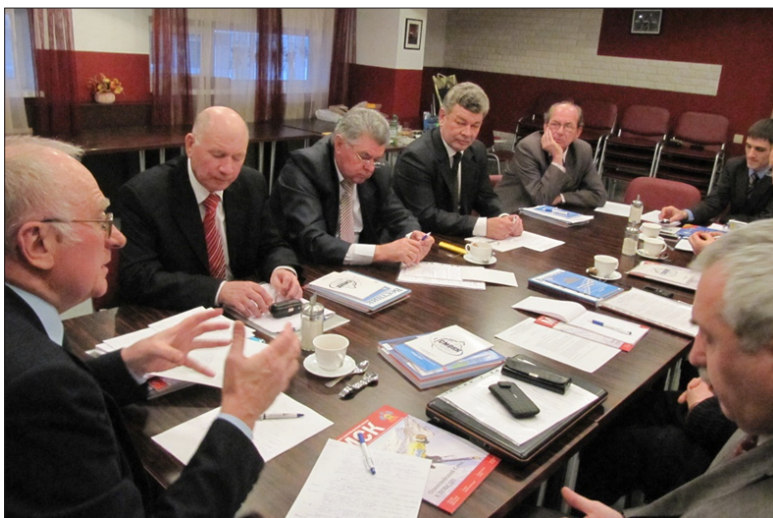
Заседание Координационного Совета регионов Юга России. г. Краснодар, февраль 2011 год